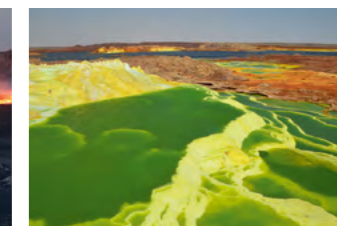
Salair du Dallol

Les amateurs de voyages ne pourront qu'être séduits par ce trip en pays Afar. Fred Lang a préparé un dossier complet à votre intention et sera à disposition pour répondre à toutes vos questions. Films et projection de photographies de 50 minutes.