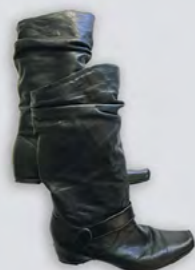
Une paire de bottes pour dame, taille 39