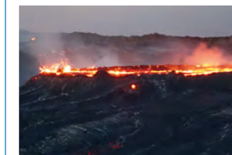
Volcan Erta Alé