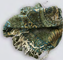
Une étole bariolée turquoise