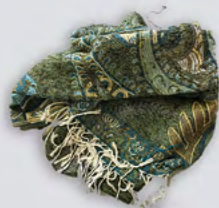
Une étole bariolée turquoise