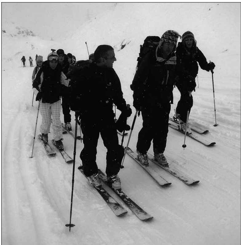
Juste après le départ, direction L'Hospice du Grand Saint-Bernard.

Il est déjà 15 heures quand à travers les flocons nous apercevons l'hospice. Il nous reste un petit mur (à plus de 30 degrés) à franchir pour l'atteindre. Leçon N° 5: nous mettons nos couteaux et travaillons de nouveau nos conversions... passaisé en pente raide! Nous voilà enfin aux portes de