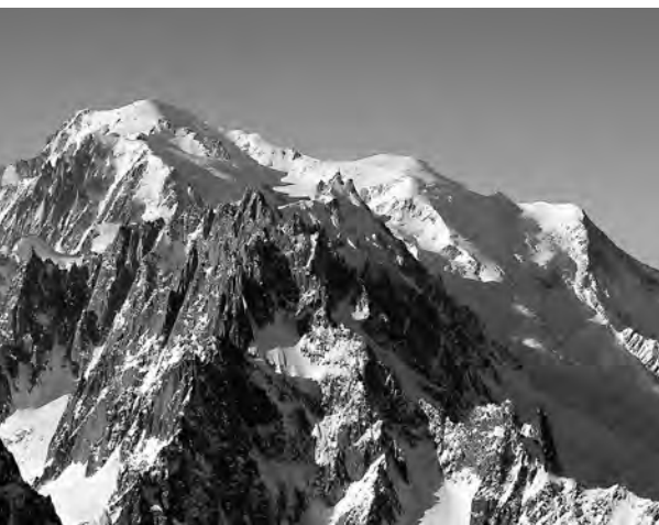
Les Aiguilles de Chamonix et le Mont Blanc, 4808 mètres.

→ Organisation des événements mensuels : deux nouveaux postes, hors comité, avec l'aide d'hôtesse d'accueil, ont été créés.