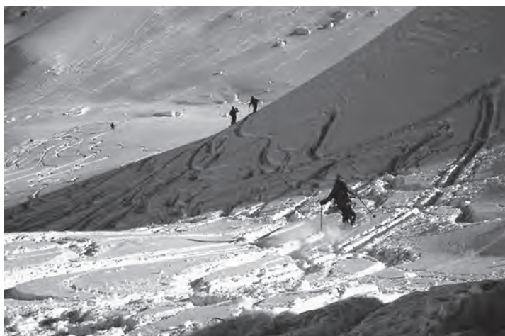
Descente dans un vallon magnifique au-dessus du village du Buet en France voisine.

Bien sûr au retour, les spécialistes ont réussi à choisir les pentes les meilleures où nous pouvons exercer notre technique dans une neige profonde. Après environ deux heures de descente nous nous retrouvons au bord du torrent, pratiquement sur les traces de montée, où une certaine habileté et des réflexes sont nécessaires pour braver les obstacles.