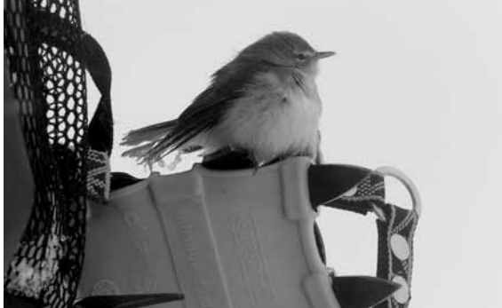
Le perchoir présidentiel