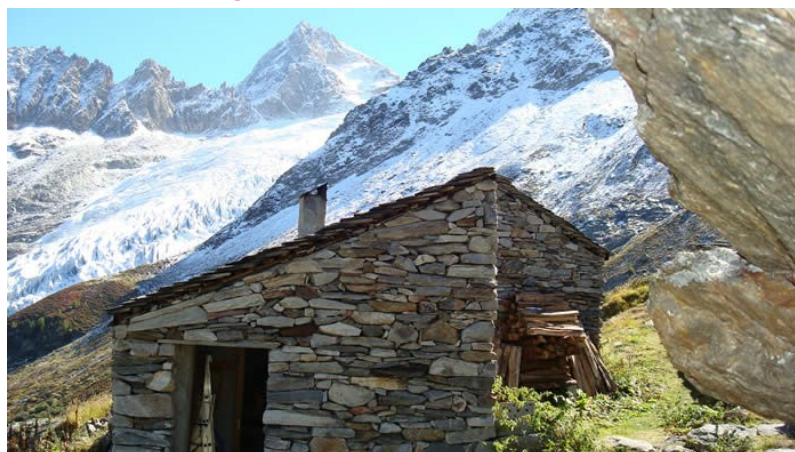
Le refuge des Petoudes

L'ouverture du refuge s'est effectuée le 15 juin et il a été fermé le 27 octobre 2019. Malgré une mise en place de la passerelle assez tardive et un changement de lit de la Tzornevette, la fréquentation du refuge est globalement excellente.