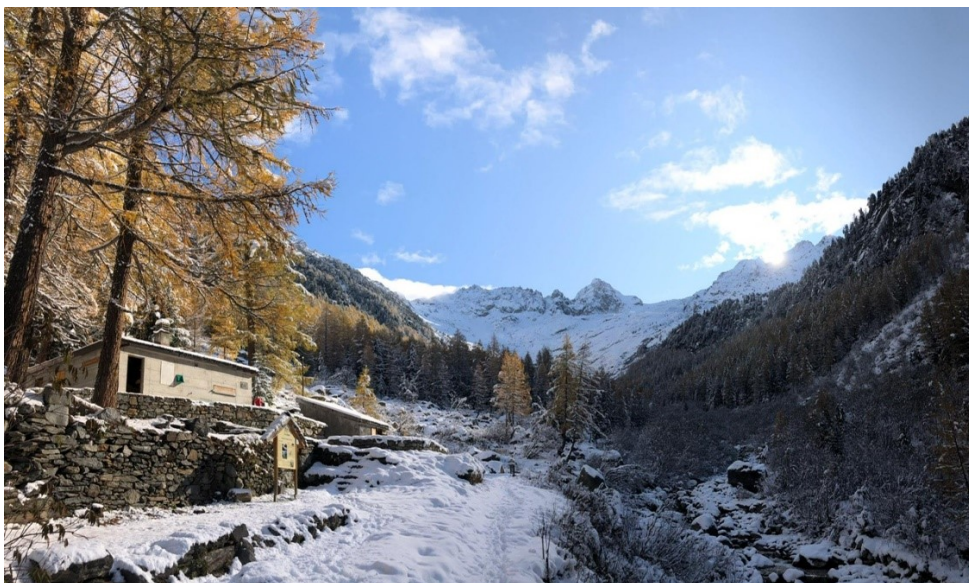
La buvette sous la neige

Le démontage s'est effectué courant novembre, en même temps que la fermeture de la buvette, de sorte qu'il a été réalisé dans des conditions hivernales.