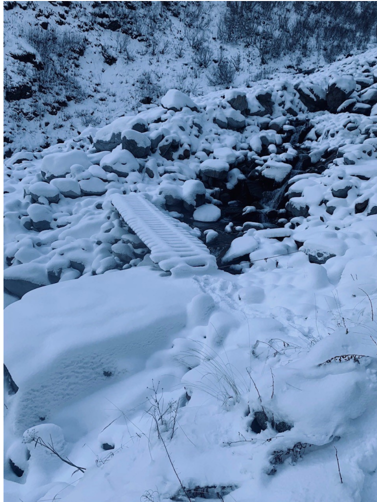
La passerelle avant démontage

https://www.youtube.com/watch?v=28is5kcr_3I&feature=youtu.be