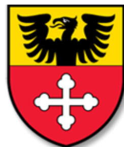
Armoiries de Remaufens

Cliquez sur les liens ci-dessous pour voir les albums en diaporama ou photo par photo, (Si aucune légende ne s'affiche, cliquez sur « i » en haut, à droite de l'écran)