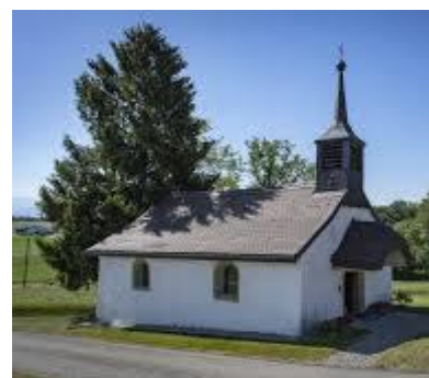
La minuscule chapelle de Hennens

« Tranché d'argent et de gueules à la tête de Minerve d'or brochante »