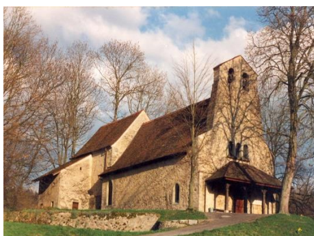
Chapelle de Curtilles avec son clocher en arcade et sa « caquette »

« D'azur à trois étrilles d'argent emmanchées d'or, posées en barre 2 et 1 »