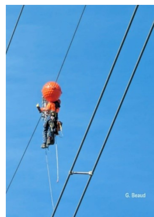
Un cycliste, parti !

Choisissez à votre gré l'un ou l'autre lien musical avant d'ouvrir les albums-photos :