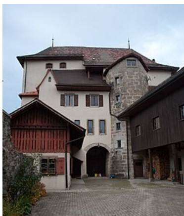
Ce qui subsiste du château d'Attalens