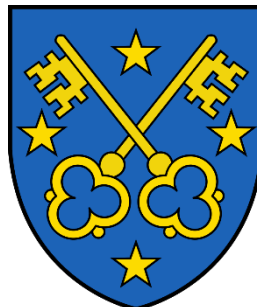
Armoiries de Lens D'azur à deux clefs d'or croisées en sautoir et cantonnées de quatre étoiles du même.