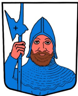
Armoiries de Venthône D'argent au buste de guerrier vêtu et casqué d'azur, tenant dans sa dextre une hallebarde du même, le tout issant de la pointe.