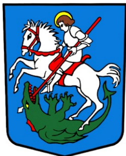
Armoiries de Chermignon D'azur au saint Georges cuirassé d'argent, nimbé d'or, monté sur un cheval d'argent bridé et sellé de gueules et terrassant de sa lance du même un dragon de sinople.