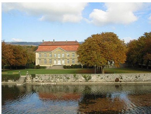
Château de l'Isle