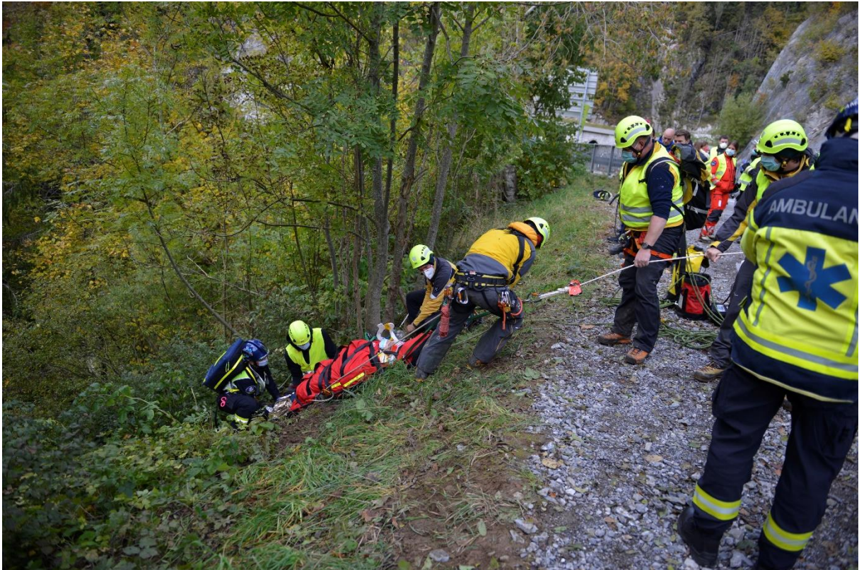
Exercice inter-services, octobre 2020