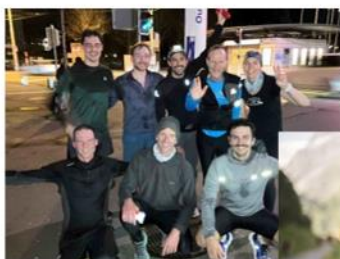
Groupe de sport en semaine sur Lausanne