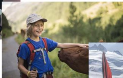
Activités famille en développement Weekend Lacombe : 7-8 sept 2024