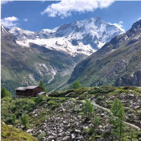
1. Monter à la cabane du Petit Mountet, et continuer sur le sentier derrière la cabane