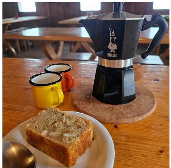
6. Après l'effort, le réconfort 😊