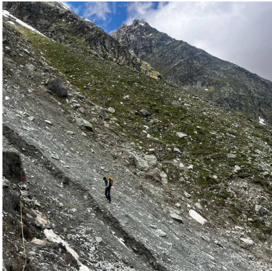
2. Avant le Plan des Lettres, traverser des couloirs pierreux équipés de cordes/chaînes