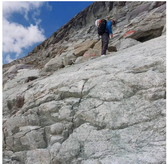
5. Remonter la moraine sous la cabane du Grand Mountet, suivre les flèches rouges et câbles