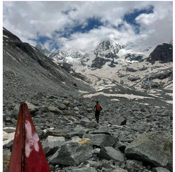
4. Traverser le glacier, suivre les plots et les cairns rouges