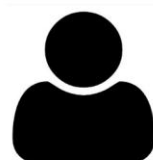
A pourvoir: Commission alpinisme