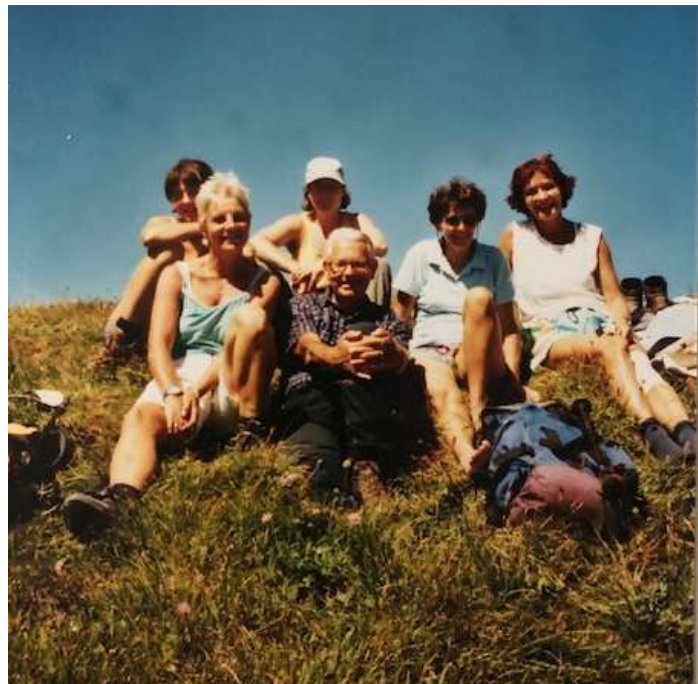
Sorties avec le CAS de Morges en 2001