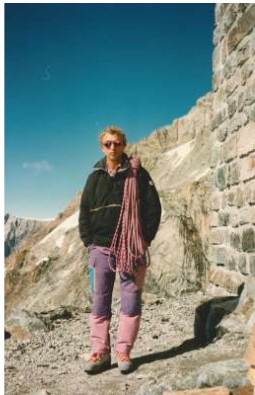
Dent Blanche, août 1994