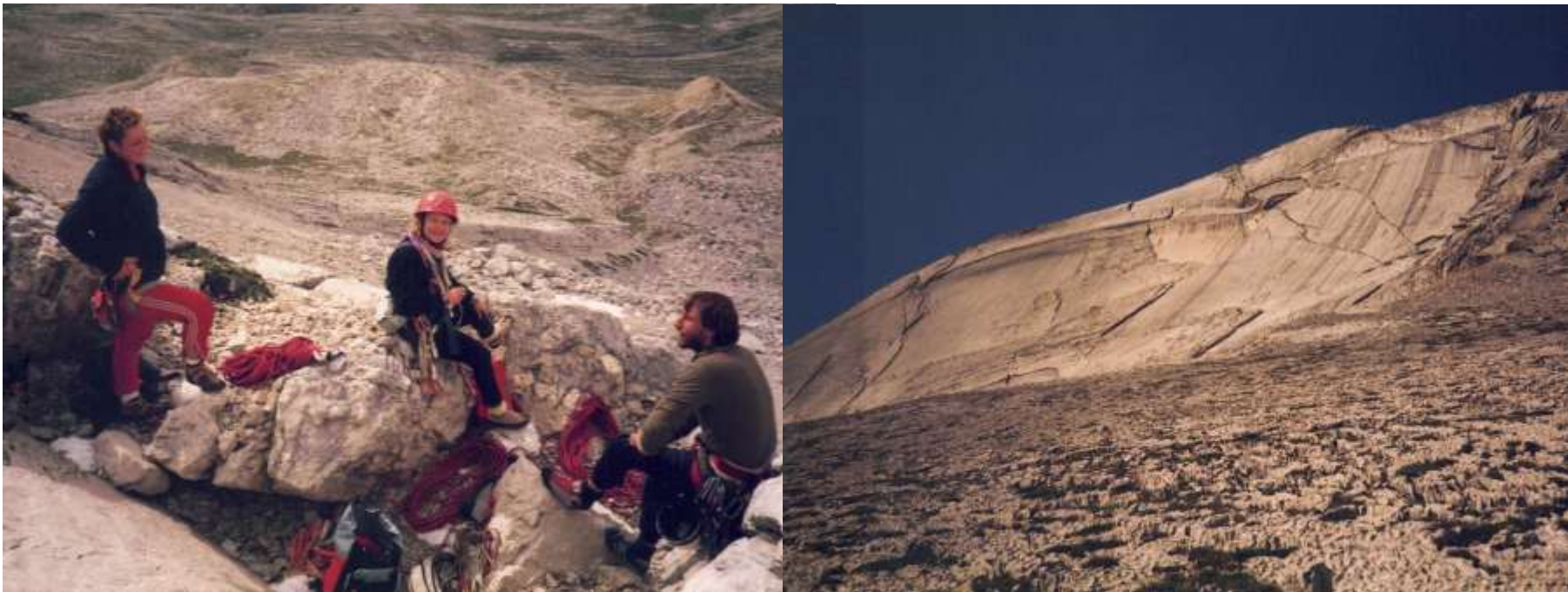
Sasso del Nove 1, Semaine Dolomites