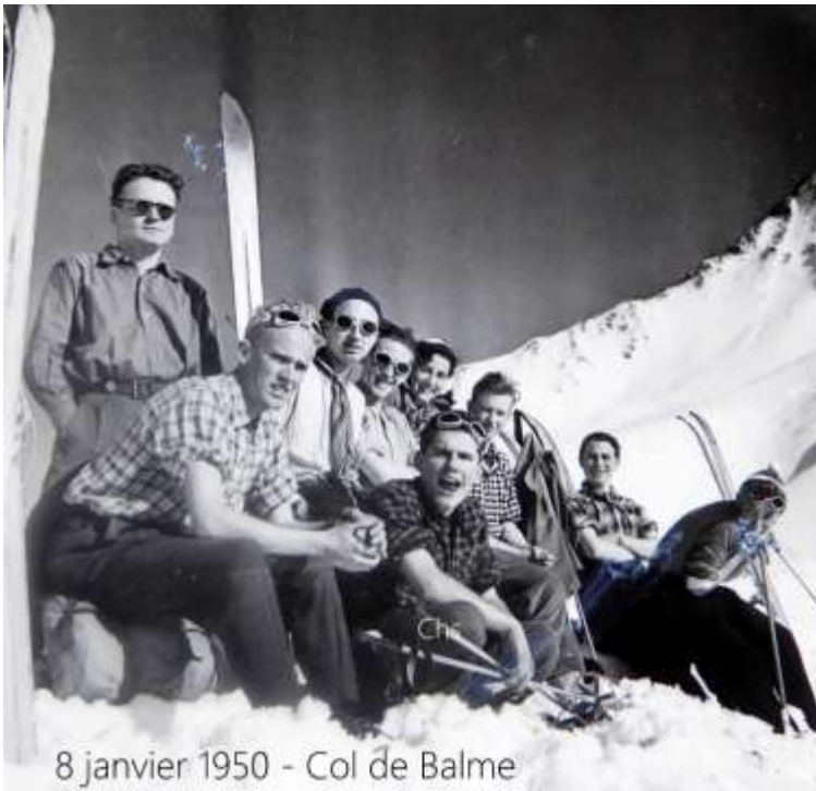
8 janvier 1950 - Col de Balme