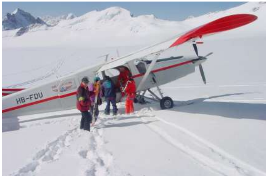
Ebene Fluh, 2003