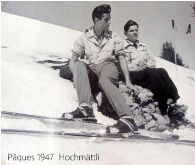
Pâques 1947 Hochmättli