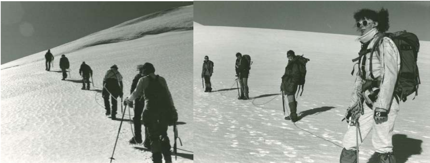
Les grandes étendues des champs de neige Week-end Tête Blanche, août 1988