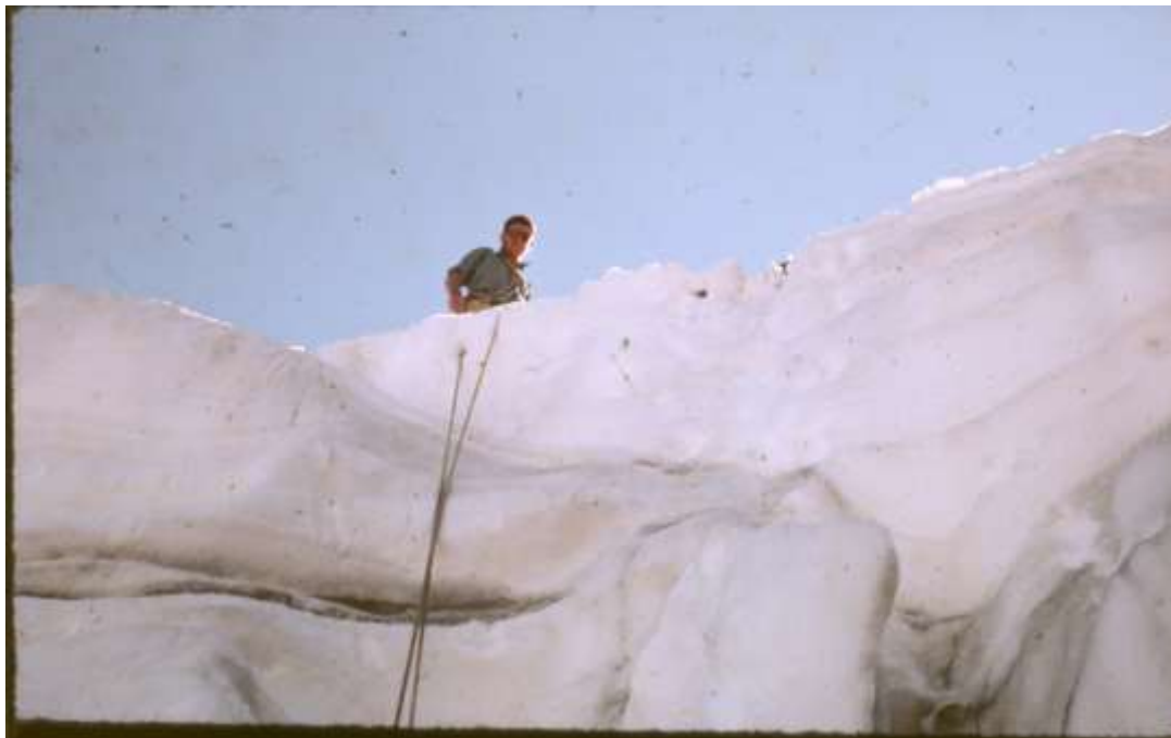
Sortie de crevasse