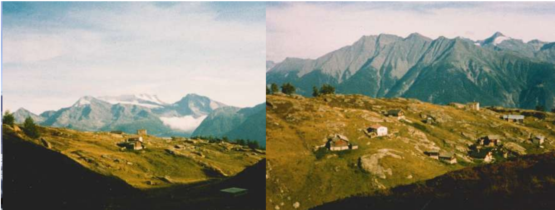
Bettmeralp, oct. 1987