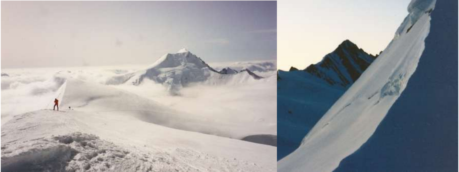
Ebene Fluh et Aletschhorn