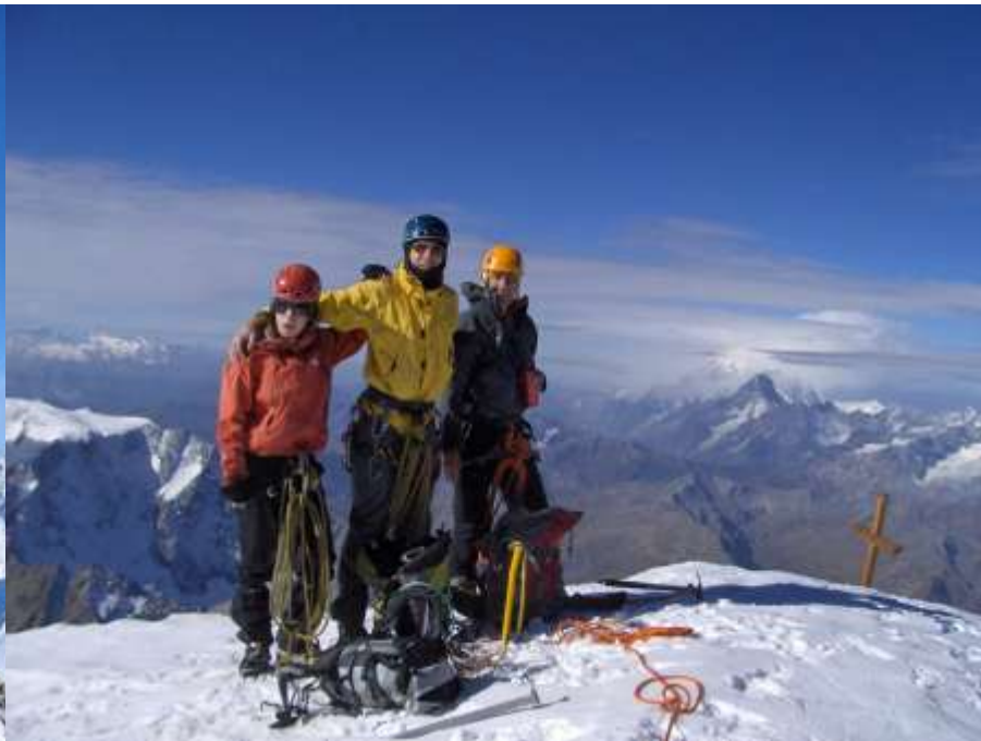
Grand Combin, 2007