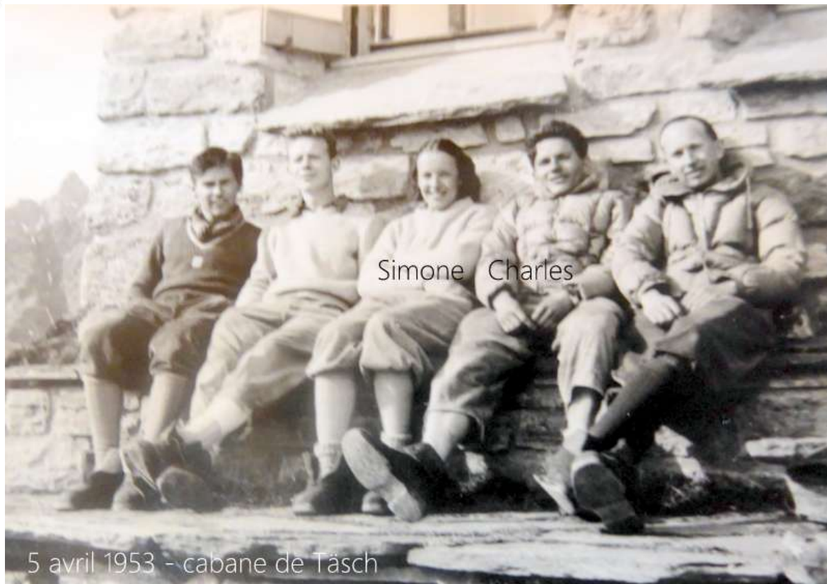
5 avril 1953 - cabane de Täsch