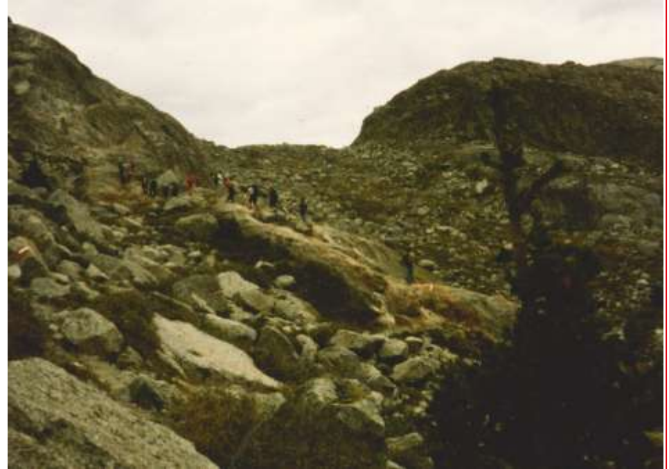
Vers l'Aletschgletscher, oct. 1987