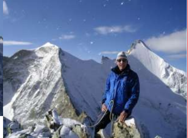
Trifhorn Simplon, 09-2007