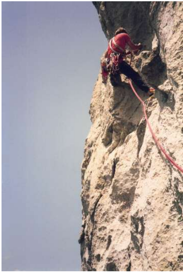
Dent de Jaman