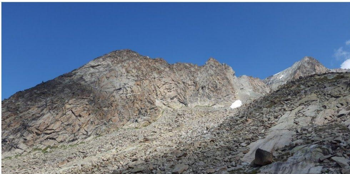
Annexe IV : Photo du Mammouth assortie d'un dessin du Mammouth datant des années 50 retrouvé dans un vieux livre de cabane